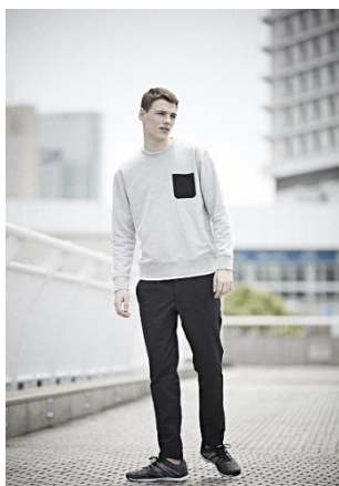
メンズ スウェットシャツ/1,499円 ストレッチテーパードパンツ/2,999円