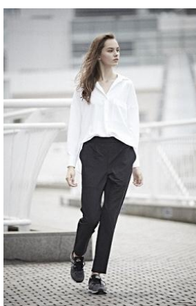
レディース ストレッチビッグシャツ/1,999円 ストレッチテーパードパンツ/2,999円