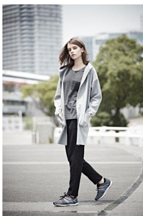
レディース フードガウンカーディガン/2,999円 ドライポケットTシャツ/999円 スウェットパンツ/1,999円