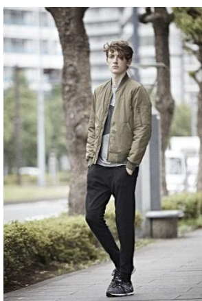
メンズ MA-1/4,999円 ドライキリカエTシャツ/999円 スウェットパンツ/1,999円