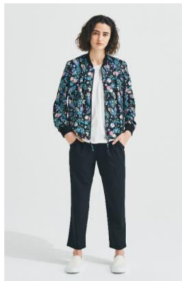
レディース サテンブルゾン ; 3,999円 ポケット付きベーシックTシャツ ; 999円 ストレッチテーパーズパンツ ; 2,999円