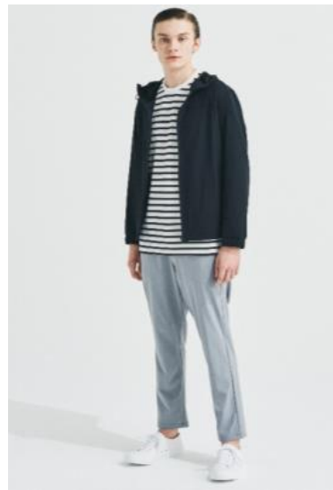
メンズ ストレッチジャケット ; 3,999円 リップルBIG Tシャツ ; 1,999円 ストレッチテーパーズパンツ ; 2,999円