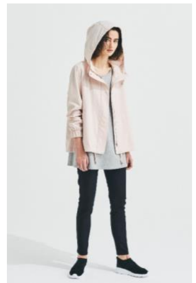
レディース フードジャケット ; 3,999円 チュニックデザインTシャツ ; 1,999円 ストレッチスキニーパンツ ; 1,999円