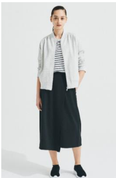
レディース カットブルゾン ; 3,999円 ポケット付きベーシックTシャツ ; 999円 フラップスカーチョ ; 2,499円