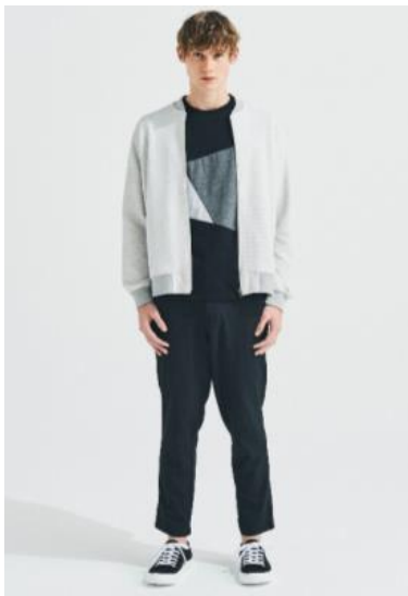
メンズ カットブルゾン ; 3,999円 キリカエデザインTシャツ ; 1,499円 ストレッチテーパーズパンツ ; 2,999円