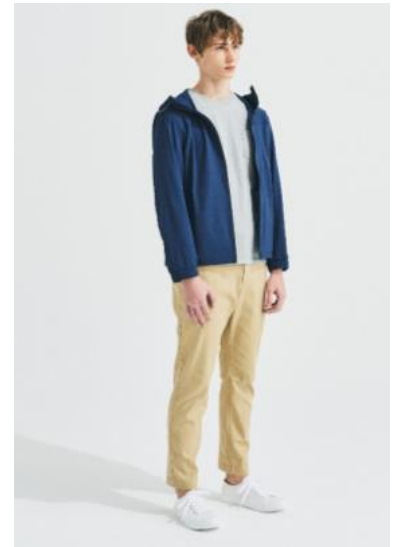
メンズ ストレッチジャケット ; 3,999円 ポケット付きベーシックTシャツ ; 999円 ストレッチチノテーパーズパンツ ; 2,999円