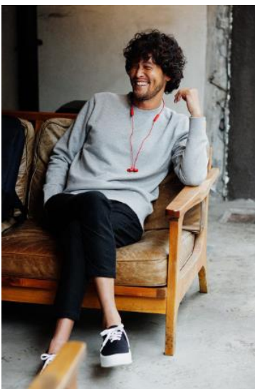
メンズ 裏毛クルーネックシャツ : 3,990円 360°ウルトラストレッチ テーパードパンツ : 3,990円