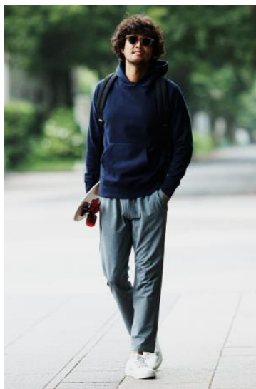
メンズ 裏毛ブルパーカ : 4,990円 iHEAT無地Tシャツ : 1,290円 ストレッチテーパードパンツ : 2,990円