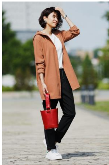
レディース フードガウンカーディガン : 2,990円 iHEAT無地Tシャツ : 1,290円 360°ウルトラストレッチ テーパードパンツ : 3,990円