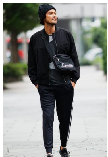
メンズ MA-1 : 5,990円 ストレッチ裏起毛切り替えTシャツ : 1,990円 サイドラインパンツ : 2,990円 キャンパスショルダーバッグ : 1,990円