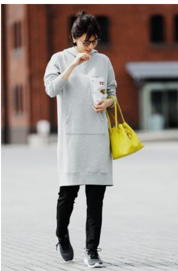
レディース 裏毛ブルパーカワンピース (長袖) : 4,990円 ストレッチ布帛コンビレギンスパンツ : 2,990円