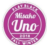
オリジナルワッペン(宇野実彩子 ver.)

今回のキャンペーンイメージキャラクターを務める宇野実彩子さん・SKY-HI さんの「オリジナルワッペン」(全 2 種)を各先着 1,000 名様にプレゼント致します。